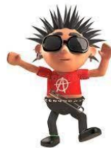
Seguir modas que no agradan a Dios