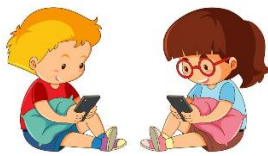
Celulares y redes sociales