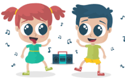
Bailar y escuchar música Mundana.

3.- La carne esto es los deseos que tenemos de hacer lo malo, de participar en las cosas que no le agradan a Dios. Por ejemplo: