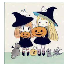
Participar de celebraciones que Dios no permite.

Podremos vencer estos obstáculos pidiendo la ayuda de Dios en oración y permaneciendo junto a Cristo, pues nosotros solos no podremos. Recuerda Separados de él nada podremos hacer. Juan 15:5 b