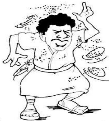
Plaga de las moscas Éxodo 8 y 9