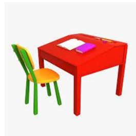
UN LUGAR ESPECIAL